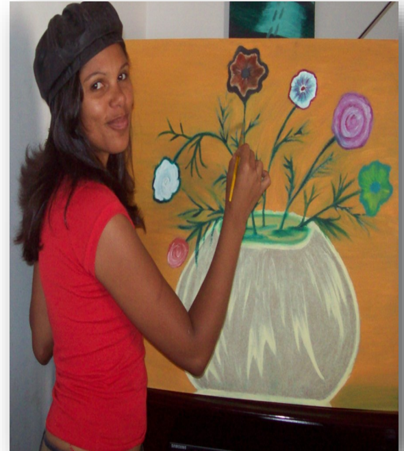
Sem ascepção de pessoas!

Pratique a paz, seja amigos de Deus e guerreiros contra as obras do diabo, não o ajude e sim o derrote através de boas atitudes, sabendo que podem contar sempre com Deus pro que der e vier.