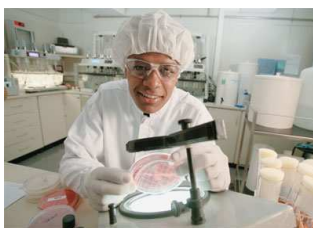
Figura 1 – Controle de Qualidade APSEN